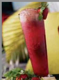
SWEET & SOUR