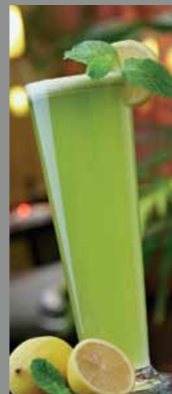
190. ЛИМОН И МЯТА